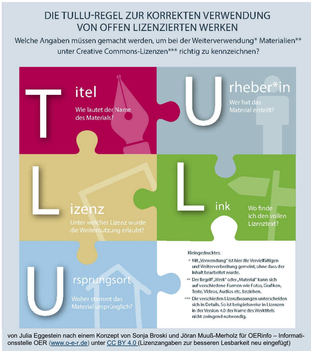
Abbildung 7: TULLU-Regeln

Beispiele für (in)korrekte Lizenzangabe nach der TULLU-Regel (gilt nur für OER-Material):