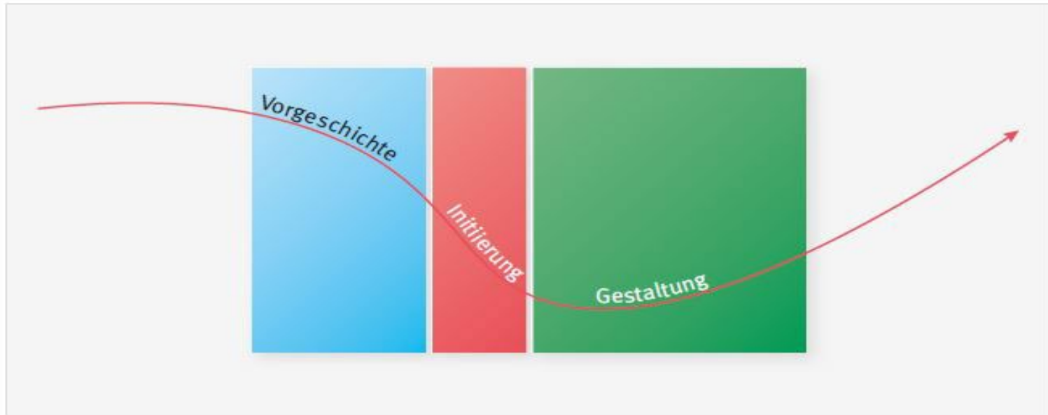
Teilhabeprozess und Jobcoachingphasen